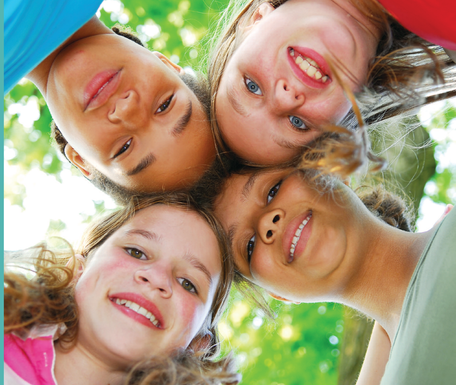
Foto: Scanstockphoto, Aktive Fredsreiser. Layout: Nina Akersveen. Trykk: Erik Tanche Nilssen as

Fredshuset, postboks 19, 4951 Risør telefon 37 15 39 00, mobil 95 23 81 99, telefaks 37 15 43 58 kontor@aktive-fredsreiser.no www.aktive-fredsreiser.no